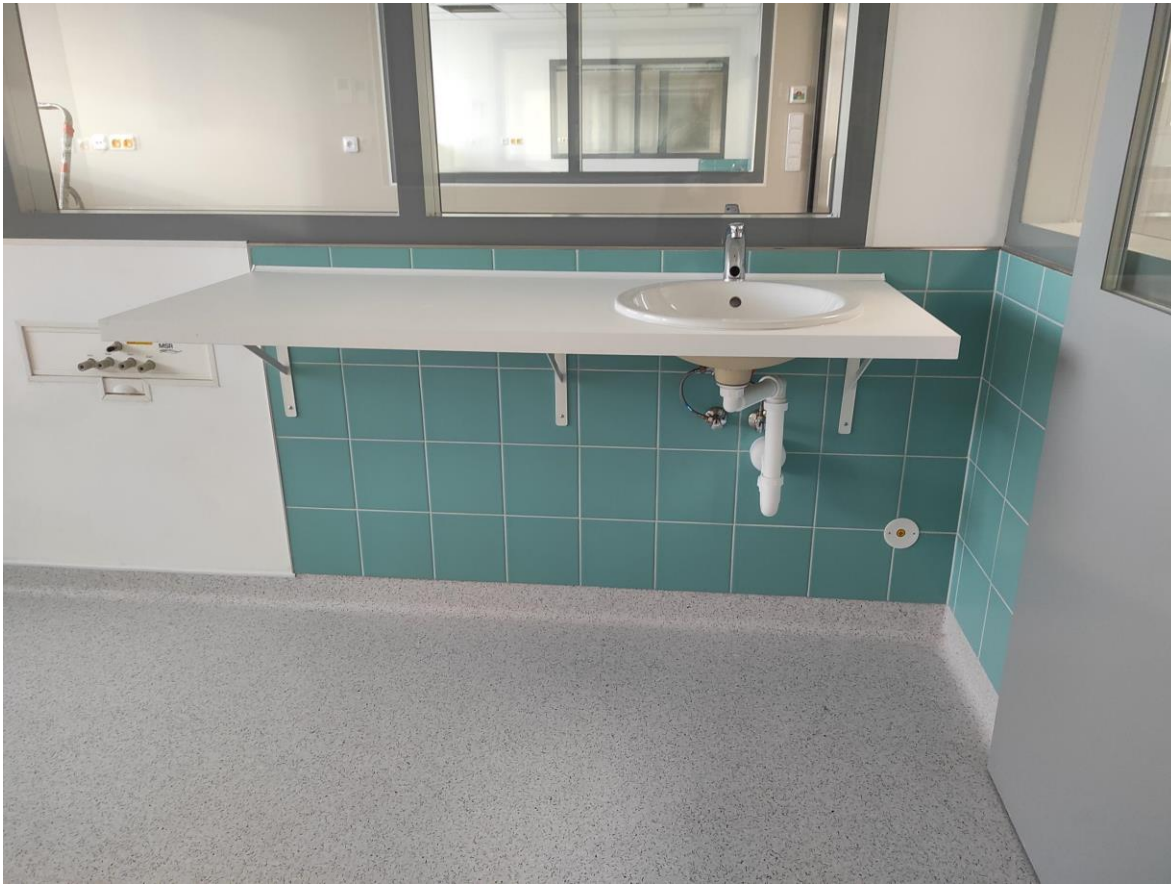
Foto stávající desky se zabudovaným umyvadlem včetně připojení odpadu a stojánkové baterie