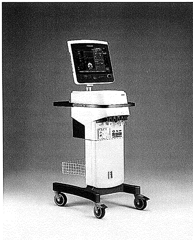
Obr: plicní ventilátor Hamilton S1 – ilustrační foto

Nabízený typ: Hamilton S1, výrobce Hamilton Medical, Švýcarsko